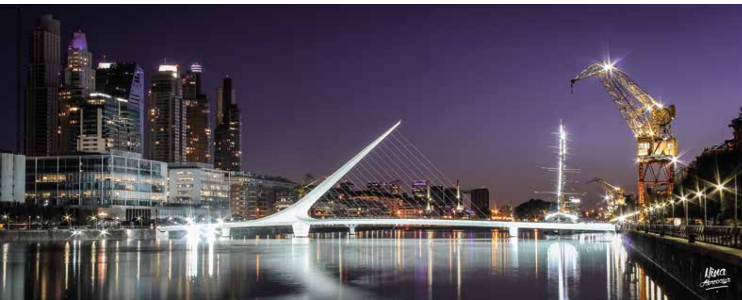
NINA ABREVAYA Paisaje urbano: Puente de la Mujer, Puerto Madero, Ciudad Autónoma de Bs. As., año 2013.