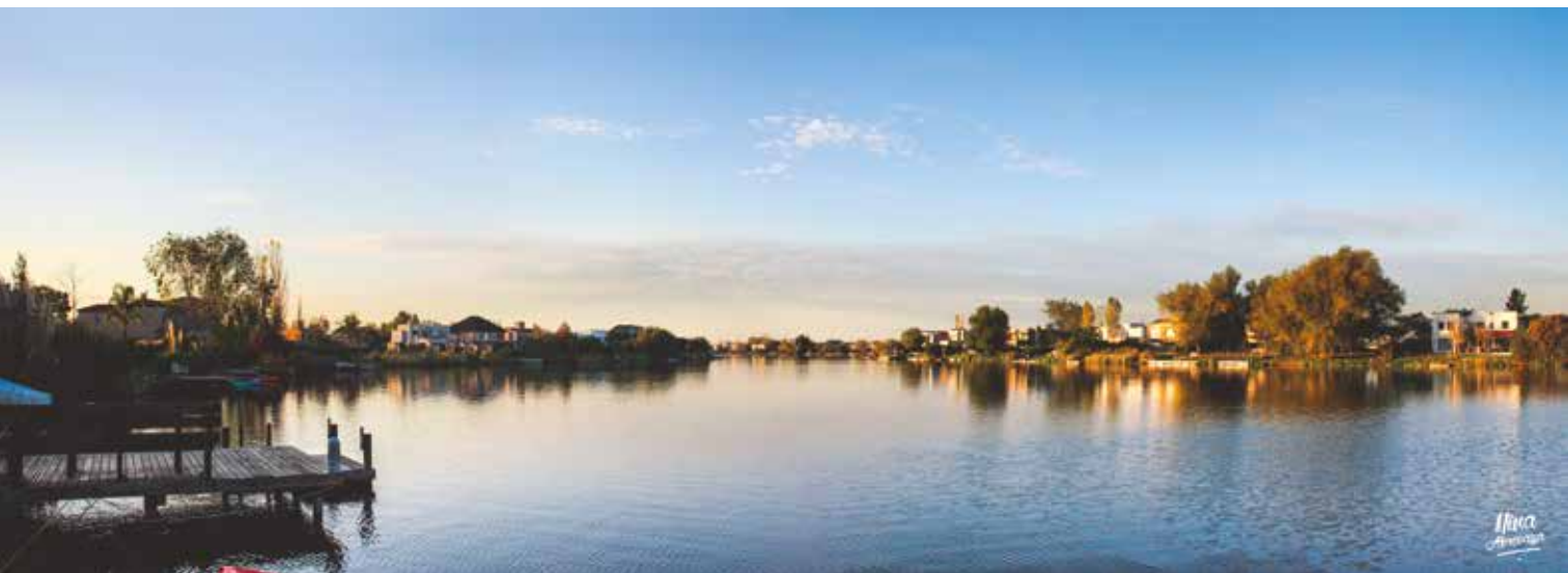
NINA ABREVAYA Paisaje: Panorámico, Tigre, Provincia de Buenos Aires, Argentina, año 2015.