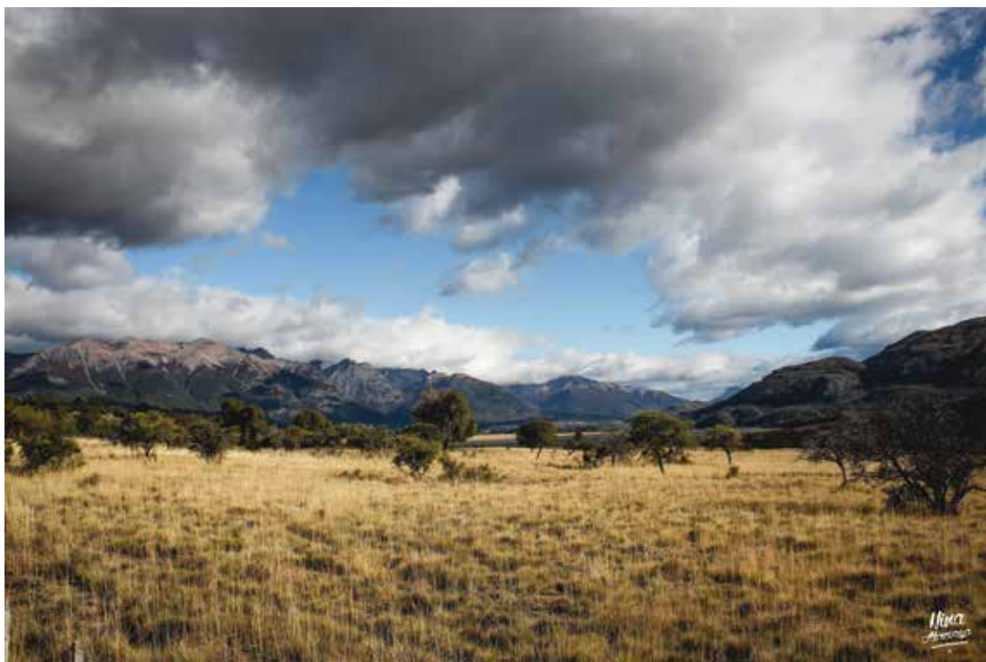
NINA ABREVAYA Paisaje, Cielo Patagónico: Parque Nacional Los Alerces, Provincia de Chubut, Argentina, año 2013.