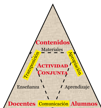
Figura 1. Triángulo didáctico

Los docentes imparten la enseñanza comunicando el contenido a través de los materiales, que es apropiado por los alumnos a través de la realización de actividades. En ese sentido, el contenido es objeto de enseñanza y de aprendizaje. A su vez, el aprendizaje se da por la interacción de los alumnos entre sí, de éstos con el docente y con los contenidos.