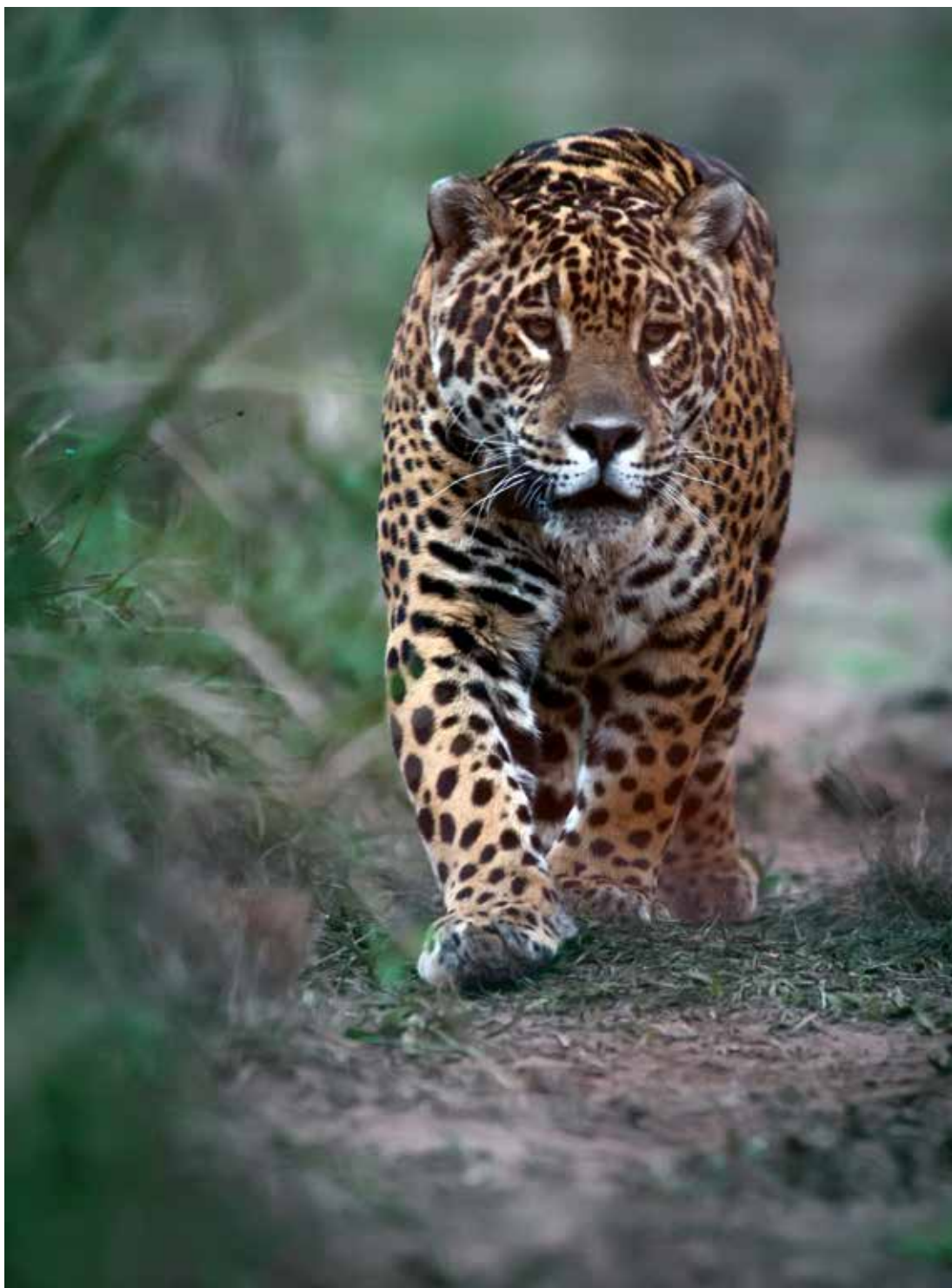
Tobuna, la Yagareté. En la Reserva San Alonso. Corrientes. 2015