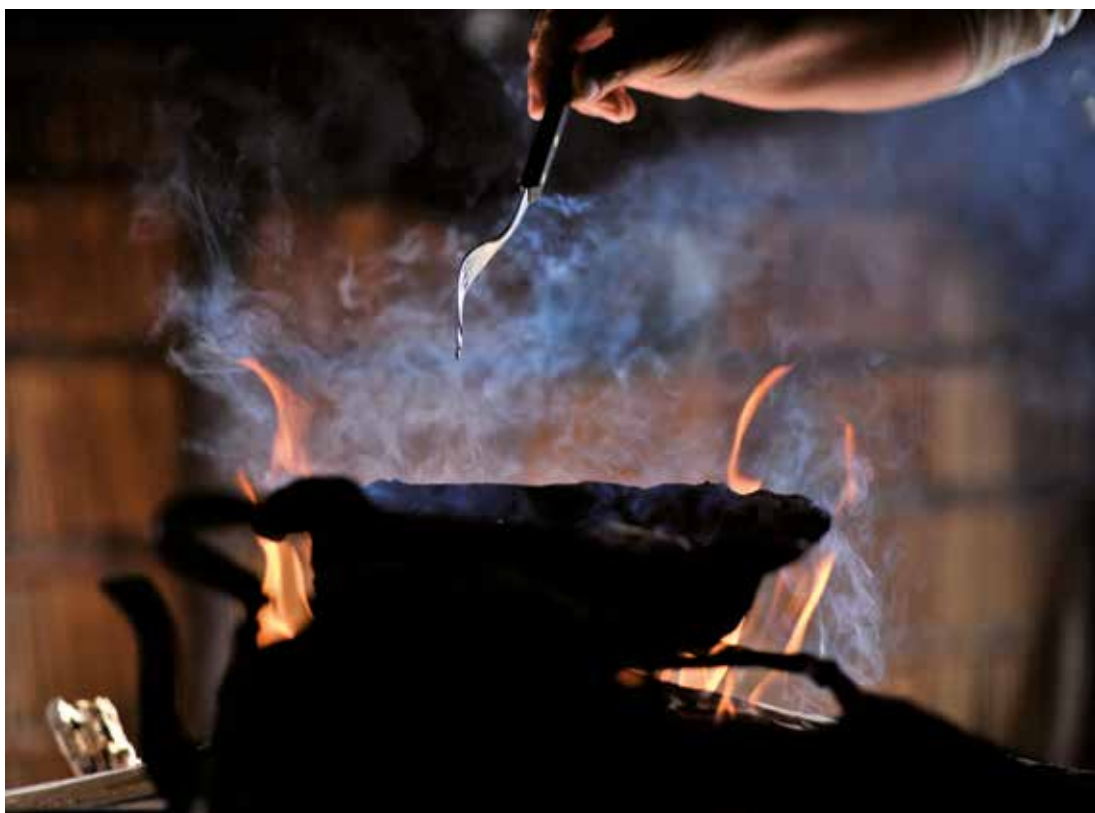
Torta frita de campo. Esteros del Iberá , Corrientes 2012