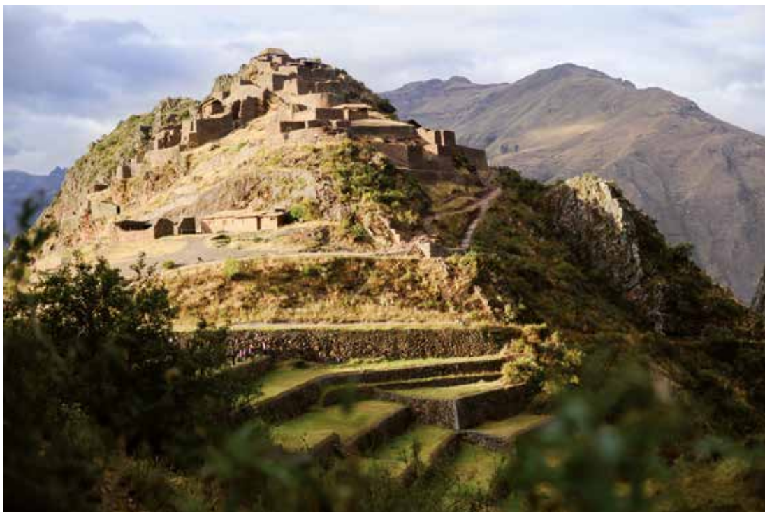
Primeros Rayos de luz . Pisaq, Templo del Sol. Peru 2016