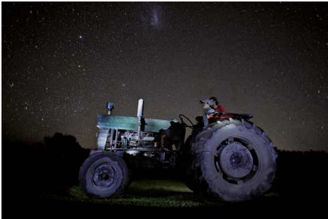
Tractor Massey Ferguson, trabajando de noche Mercedeces, Corrientes 2014