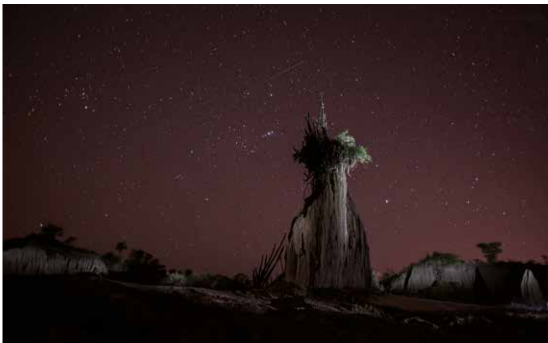
Empedrado, Corrientes. 2015