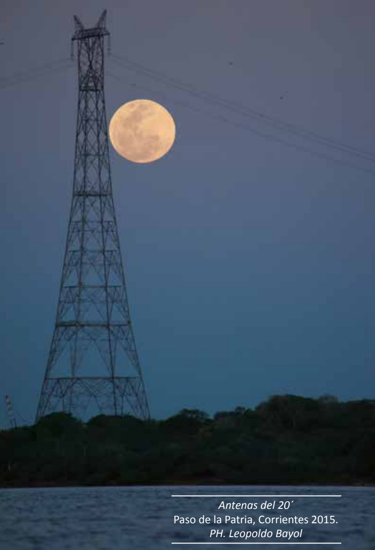
Antenas del 20' Paso de la Patria, Corrientes 2015.