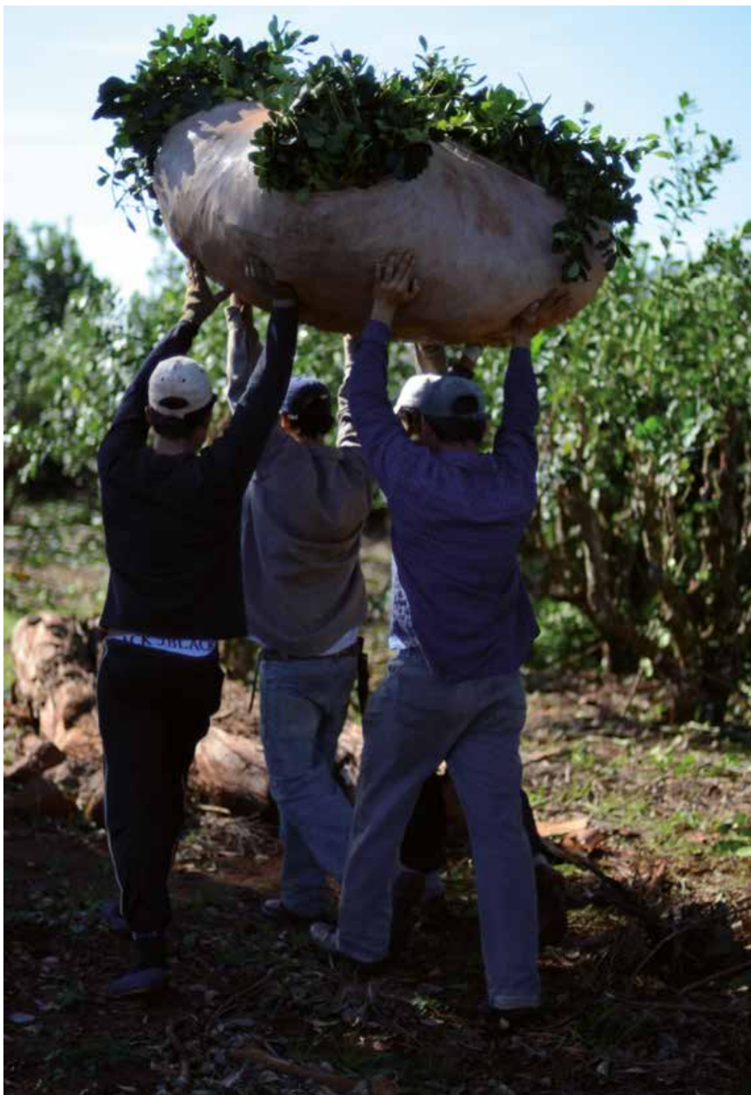
Tareferos. Obera, Misiones 2012