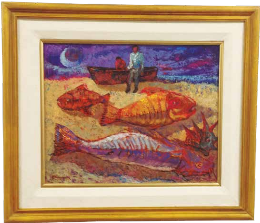
Pesca nocturna - Rodolfo Schenone