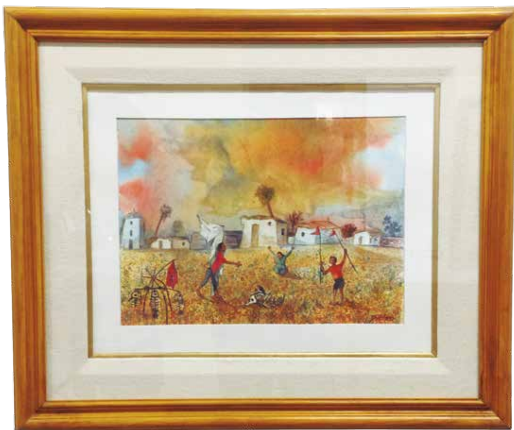
Llega la tormenta - Rodolfo Schenone