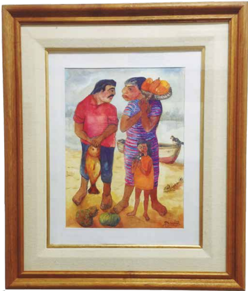
Cotidiana del Paraná - Rodolfo Schenone