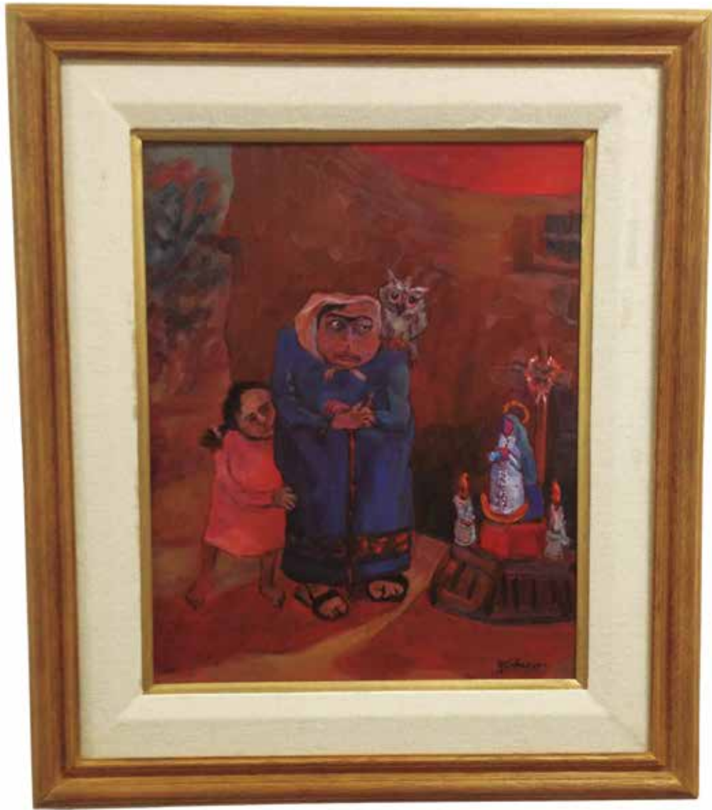
Crepúsculo - Rodolfo Schenone