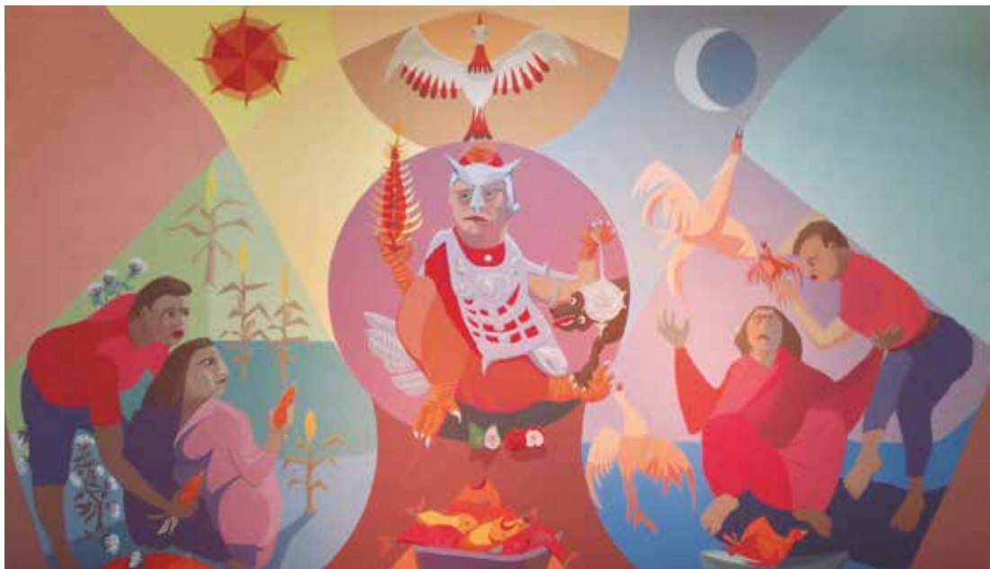
Mujer-Águila - Rodolfo Schenone