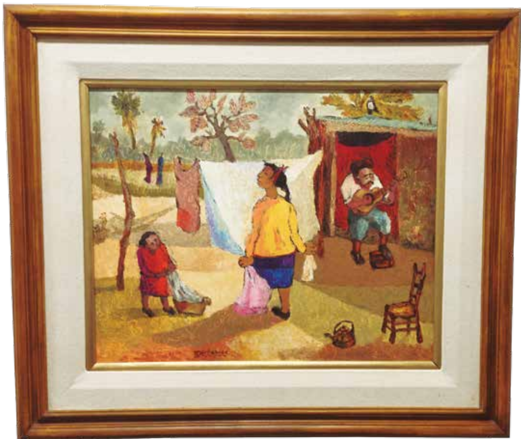
A pleno sol - Rodolfo Schenone