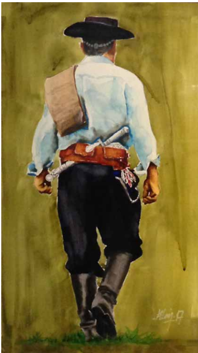
"Poncho" 2017 Jorge Eduardo Levin