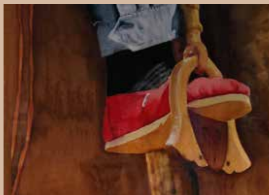
"Alpargata" 2017. Jorge Eduardo Levin