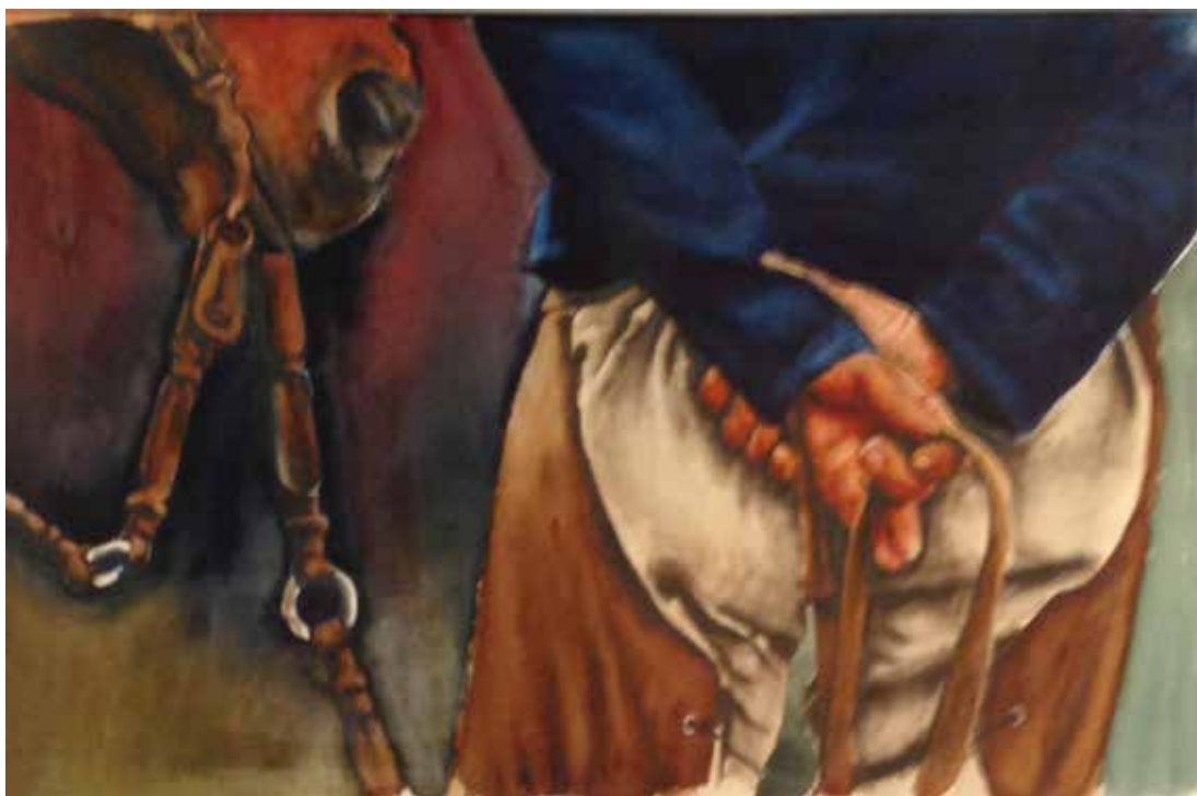
"Esperando" 2017 Jorge Eduardo Levin