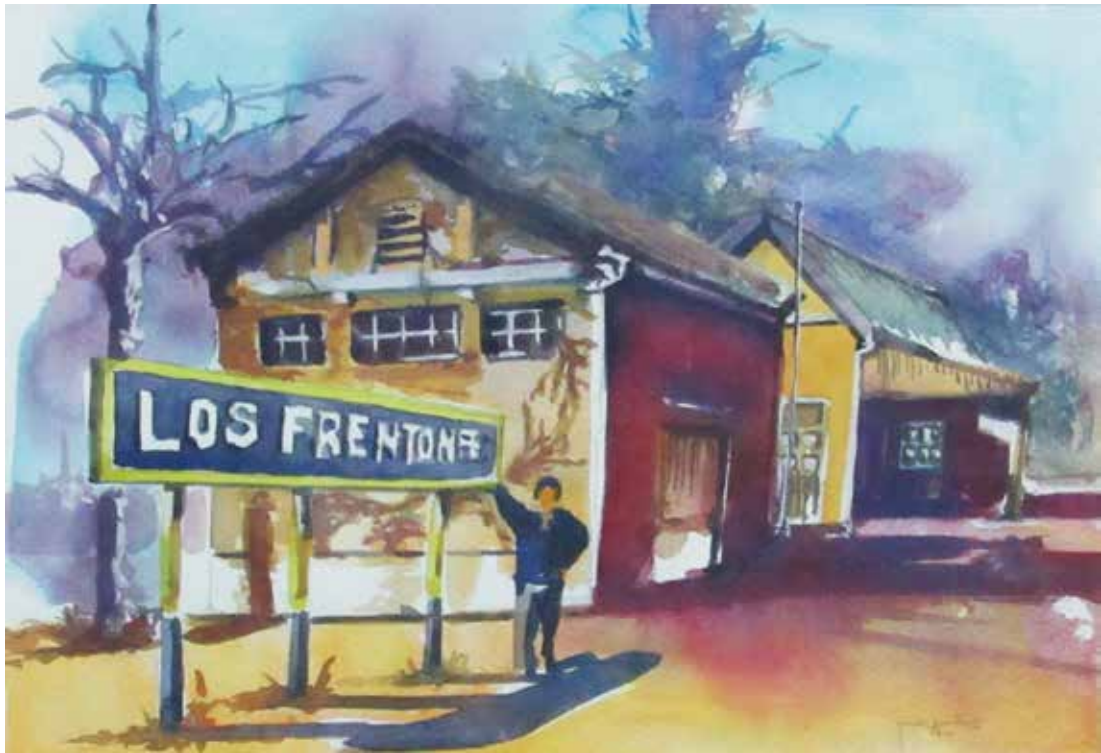
ESTACIÓN LOS FRENTONES