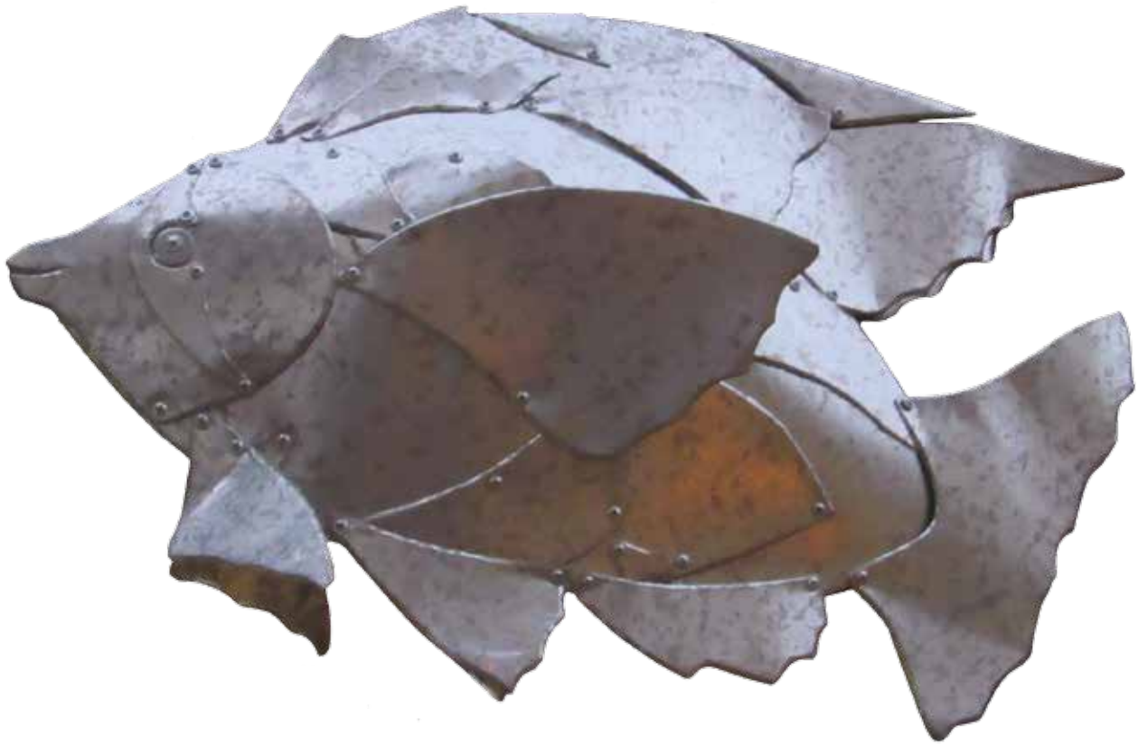
PEZ 1 Ruben Mañas