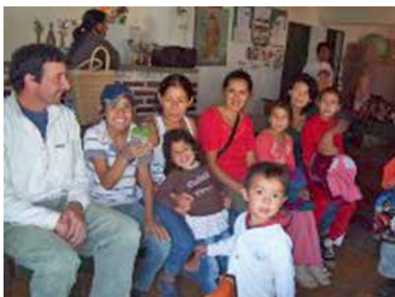
Asistencia de las familias a las convocatorias