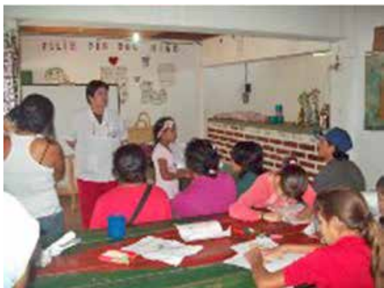
Charlas de educación para la salud