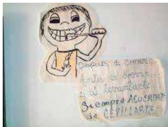
Elaboración de material didáctico por las madres y los niños