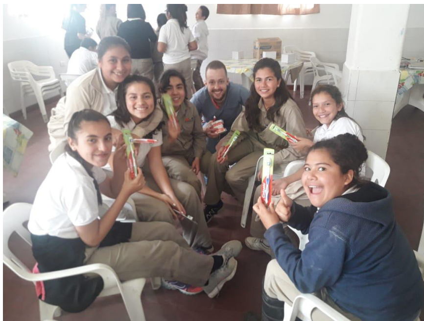
Figura 5. Trabajo grupal.