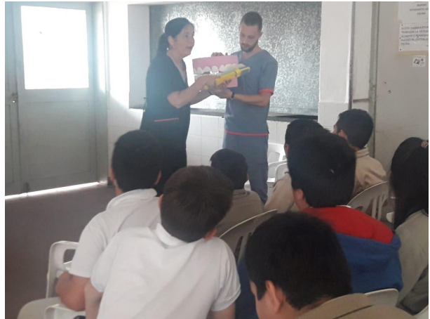
Figura 4. Charla a los destinatarios.

La realización de éste Proyecto permitió que la población de adolescentes acceda a información actualizada sobre las afecciones de la cavidad bucal y las formas de prevenirlas. A través de la actividad taller realizada con los alumnos de la Escuela, se logró la exposición de inquietudes, erradicando dudas sobre cuestiones referidas a los temas trabajados, asumiendo el compromiso del cuidado de la salud bucodental, a través de la higiene bucal diaria y adecuada. La visualización de la placa bacteriana ha generado alto impacto en los destinatarios, permitiendo la toma de conciencia acerca de la importancia del cuidado de la salud bucodental.