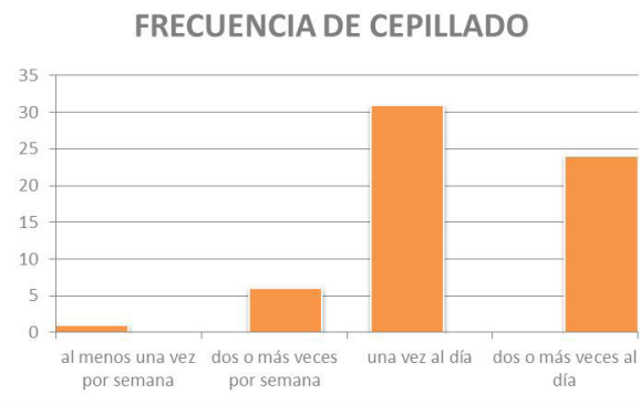
Figura 3. Frecuencia de cepillado diario

El trabajo realizado, permitió que los miembros de la comunidad destinataria identifiquen los factores que desencadenan las enfermedades que afectan a la cavidad bucal y las formas de prevenirlas, impactando directa e indirectamente (Figura 4 y 5).