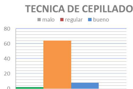
Figura 2. Técnica de cepillado que aplican diariamente.