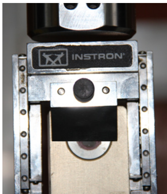
Figura 2. Prueba de cizalla con la máquina universal de ensayo Instron.