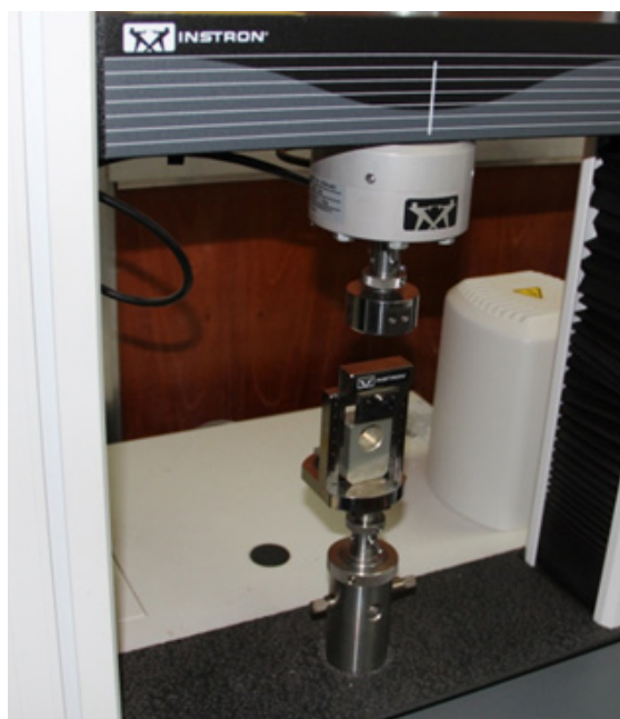
Figura 1. Máquina universal de ensayos Instron modelo 3366.

Estudios demostraron 13 de forma significativa una mayor resistencia utilizando como profilaxis pasta de profilaxis fluorada y spray de bicarbo-