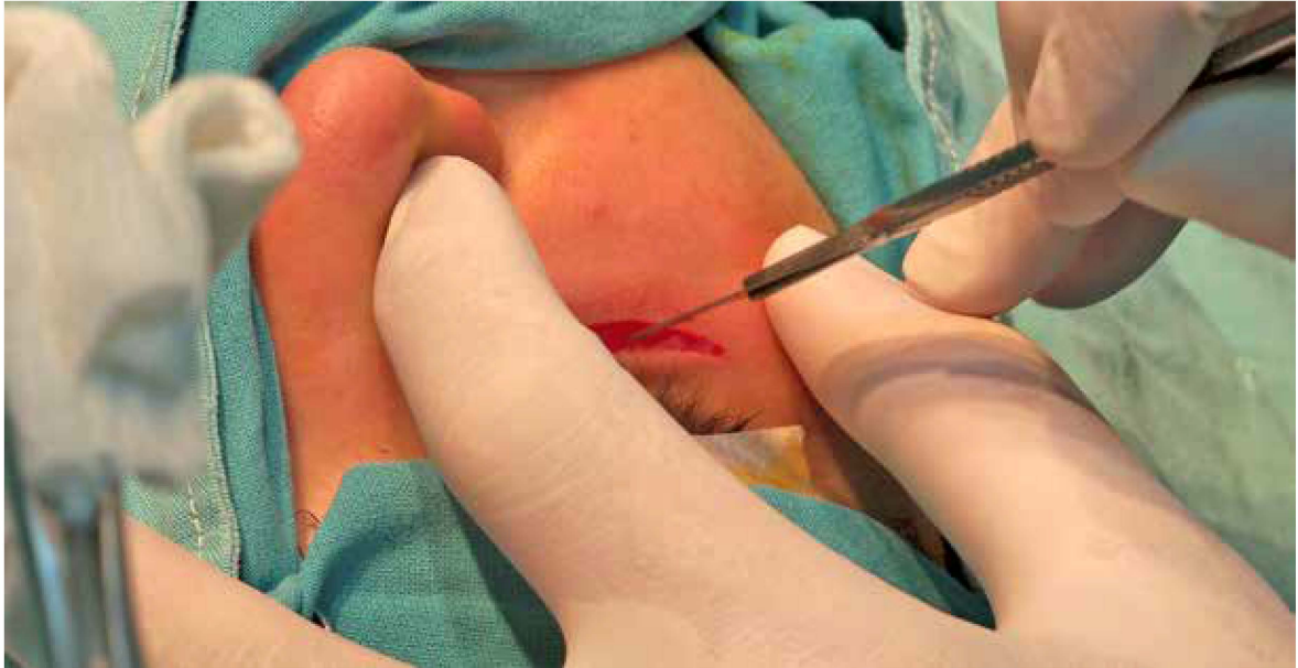
Figura 4. Acceso subciliar para reborde infraorbitario y piso de órbita.

bajo anestesia general con intubación nasotraqueal. Luego se procedió con la preparación del paciente y del campo quirúrgico.