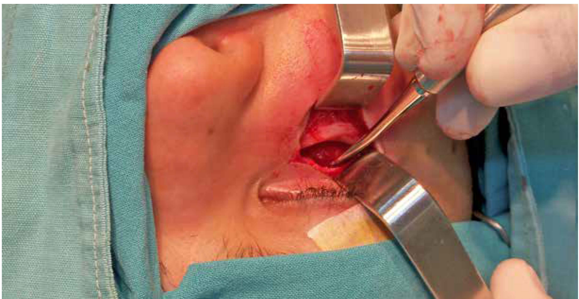
Figura 5. Abordaje del piso de la órbita.

Abordado el foco de fractura, el piso de la órbita se revisó con cuidado mediante una legra, levantando el periostio hasta encontrar la línea de fractura o eventualmente la rotura de éste; en caso de que se hubiese presentado este último, se presentaría una amplia apertura hacia el seno maxilar 6 . Seguidamente se realizó una reducción abierta y exposición de todos los focos de fractura implicados.