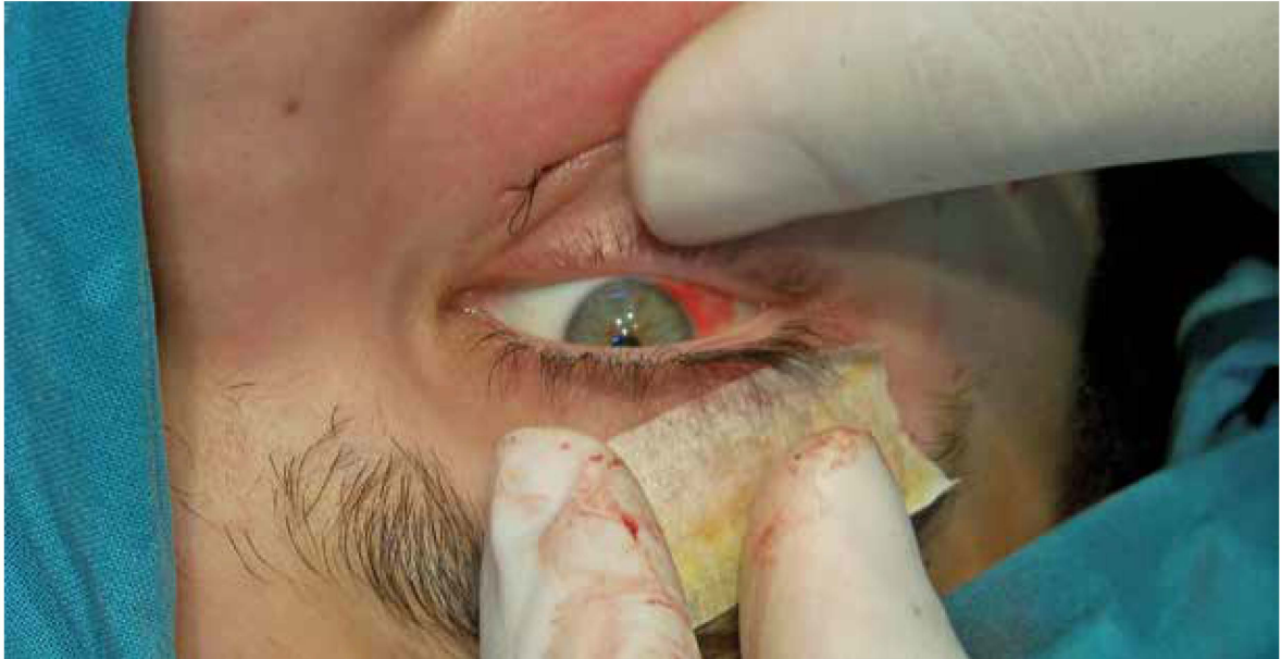
Figura 7. Las pruebas de conducción forzada consisten en asir los músculos extraoculares y asegurarse de que el globo se puede movilizar en todas las direcciones.

hospital por 24 horas donde se efectuaron las revisiones postoperatorias para evaluar la evolución del paciente insistiendo sobre todo en la función ocular. Todos los indicadores fueron de resultado favorable con obtención de los objetivos terapéuticos prefijados y ausencia de sintomatología atribuible a la fractura orbitocigomática. Sólo se observó inflamación de la zona periorbitaria, siendo ésta una manifestación fisiológica que puede mantenerse alrededor de una semana. El periodo de reposo laboral habitualmente no supera las tres semanas.