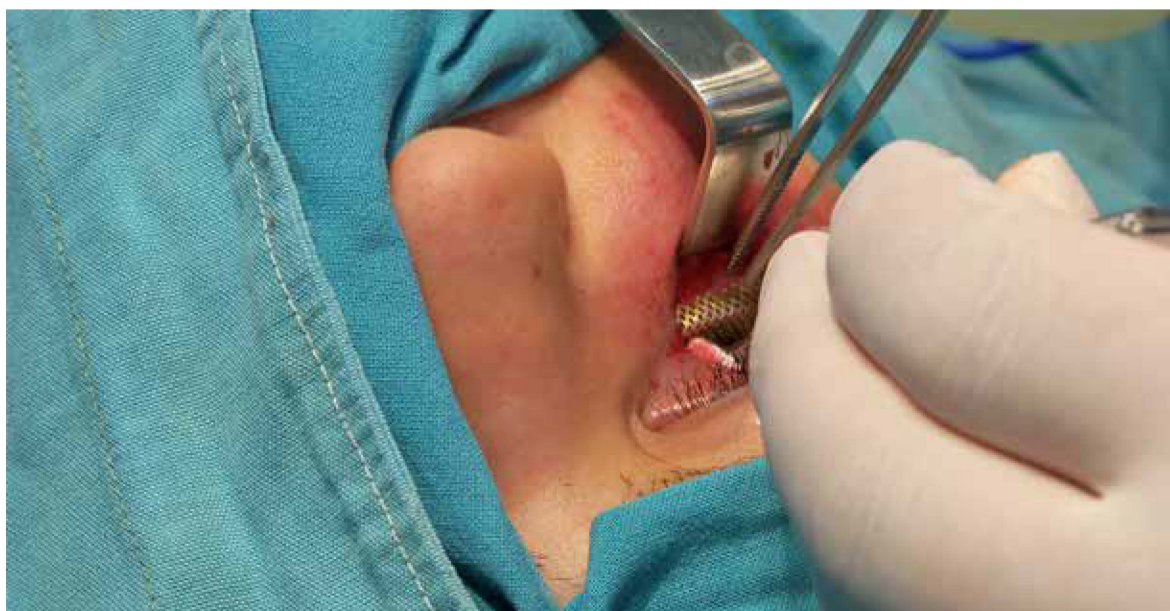
Figura 6. Colocación de la malla de titanio de un espesor de 0,15 mm. Estas son delgadas, lo que permite el ajuste y modelaje fácilmente, de modo que puede adaptarse al contorno del piso de la órbita y promover el apoyo eficaz de grandes defectos.

Una precaución a tener en cuenta es que los músculos extraorales no queden pinzados por el elemento colocado y que el suelo de la órbita no resulte "sobrerreducido". Se ha descrito un caso de ceguera producida por la penetración de fragmentos óseos en el interior del suelo de la órbita y la consiguiente lesión del nervio óptico. Una vez que se reparó el traumatismo causante de la lesión de la órbita, se practicaron las pruebas de movilización forzada de los globos oculares. Estas pruebas consisten en sujetar delicadamente los músculos extraoculares a través de la conjuntiva con un pequeño fórceps o pinza dentada y girar el globo en todas las direcciones. Si un músculo queda trabado en un punto de fractura, se observará que existe una dificultad en el giro del globo ocular en la dirección de este músculo. El paciente fue mantenido en observación en el