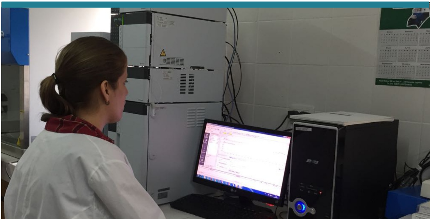
Mediante técnica cromatográfica se conoce la cinética de la liberación de la droga en el equino.

La propiedad del poloxámero de facilitar la incorporación de principios activos insolubles en solventes acuosos, como es el caso de IVM fue considerada para la selección del polímero como vehículo para el desarrollo de la segunda formulación. Los poloxámeros son sustancias de características tensioactivas (emulsionantes), formados por la unión de bloques moleculares de polioxietileno (hidrófilo) y polioxipropileno (hidrófobo). La concentración ideal de poloxámero para la formulación del gel de IVM, en el presente trabajo, fue de 40%.