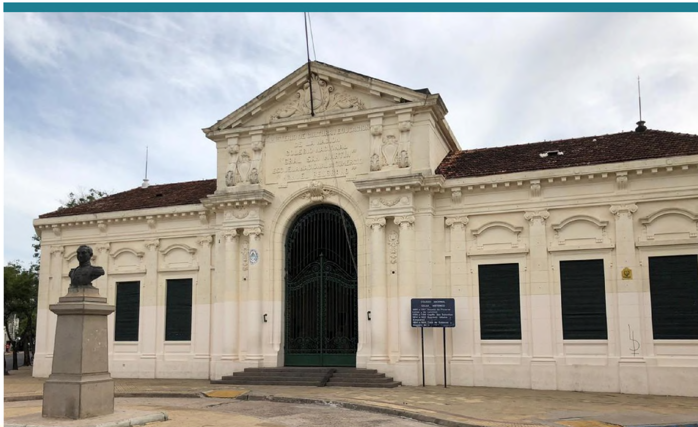
El 150° Aniversario del Colegio posibilitó que la sociedad en general conozca más sobre la historia de la institución

En las acciones para celebrar el aniversario del establecimiento escolar, la Universidad Nacional del Nordeste (UNNE) tuvo un rol importante colaborando con el colegio en los objetivos de recuperar trazos de la historia institucional, ponerlas en valor y visibilizar los momentos más importantes de la vida institucional.