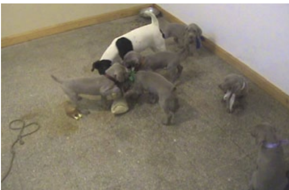
Figura 3. Detalle de la madre alternativa durante la filmación, compartiendo actividades con los cachorros.