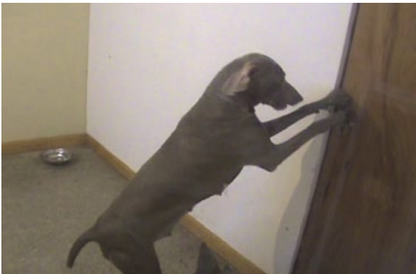
Figura 2. Detalle de la madre biológica durante la filmación, mostrando el cuadro de ansiedad por separación.

En la segunda parte del estudio, se retiró a la madre biológica y los cachorros se colocaron con la madre adoptiva. Ésta fue la que tomó la iniciativa de contacto