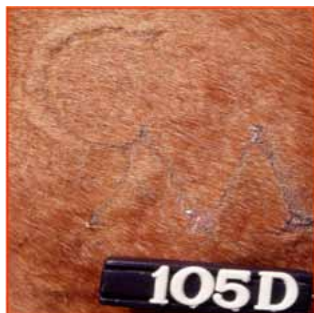
Figura 3. Marca a fuego completamente cicatrizada en equino de pelaje bayo ruano (día 105).