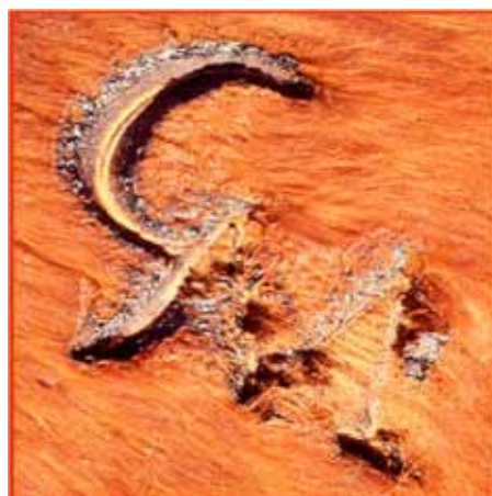
Figura 1. Marca a fuego con zona central de color amarillento y aspecto apergaminado; zona periférica con pelos chamuscados (día 1).

Día 48: se observó una retracción cicatrizal notable de la marca, cuyos bordes se hallaron cubiertos de escamas blancas.