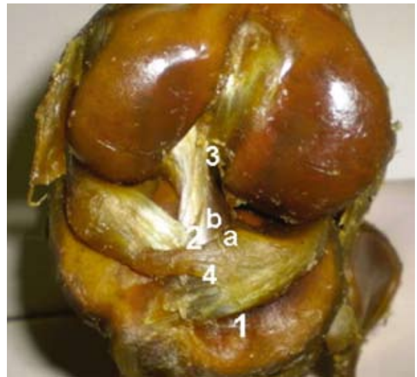
Figura 4. Babilla del cerdo, vista craneal. 1: inserción craneal del menisco medial, 2: inserción del menisco lateral, 3: ligamento cruzado craneal (a: rama superficial, b: rama profunda), 4: ligamento transversal.