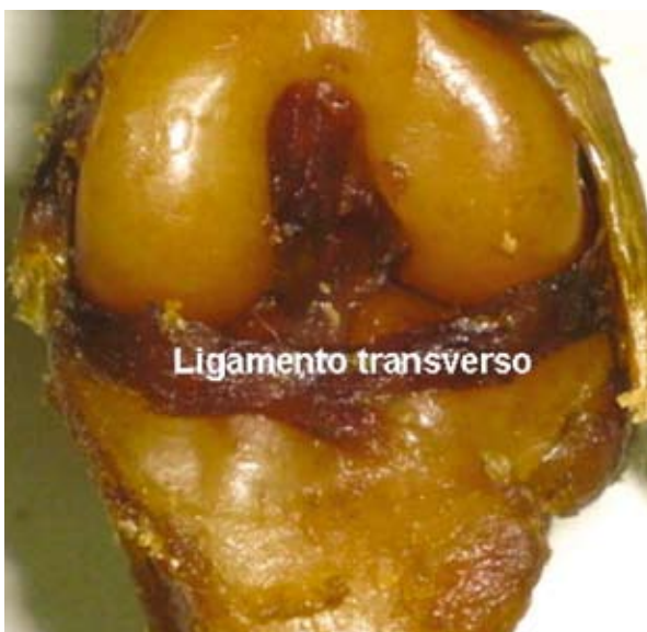
Figura 5. Babilla del perro, vista craneal con exposición del ligamento transversal.