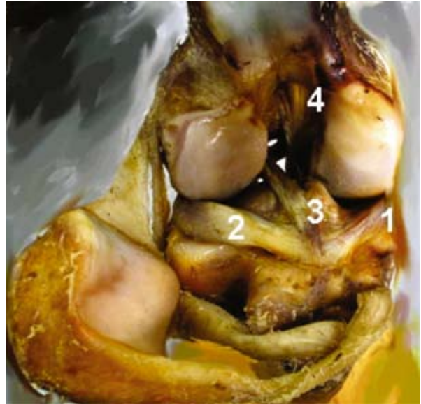
Figura 1. Babilla del equino, vista craneal. 1: inserción craneal del menisco medial, 2: inserción craneal del menisco lateral, 3: inserción del ligamento cruzado anterior, 4: origen del ligamento cruzado posterior.

El ligamento cruzado craneal de rumiantes, cerdos y carnívoros se diferenció de su homólogo del equino porque en aquéllos, se dividió en dos ramas, una craneal y superficial que se insertó entre los extremos craneales de los meniscos y otra caudal que lo hizo en el área intercondílea central (Figuras 2, 3 y 4).