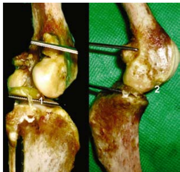
Figura 6. Babilla del perro. Ligamento tibiomeniscal (1: lateral, 2: medial).