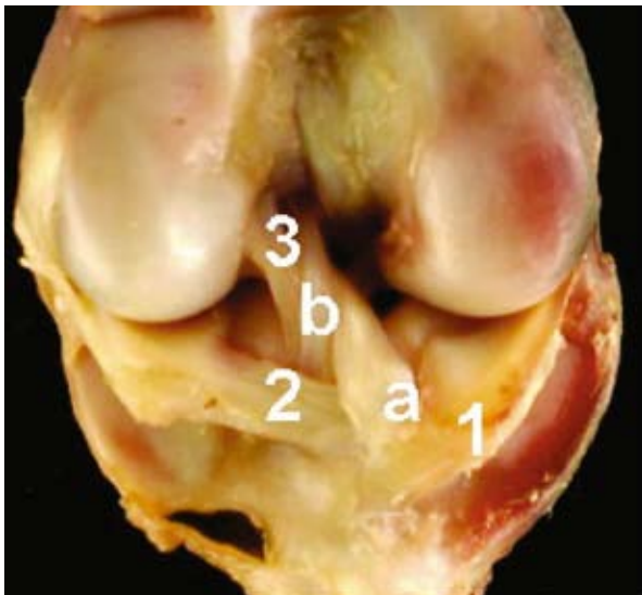
Figura 3. Babilla de pequeños rumiantes, vista craneal. 1: inserción craneal del menisco medial, 2: inserción del menisco lateral, 3: ligamento cruzado craneal (a: rama superficial, b: rama profunda).