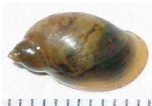
Figura 1. Pseudosuccinea columella . La escala indica milímetros.

Los caracoles colectados fueron acondicionados convenientemente y transportados vivos en bolsas de polietileno gruesas con agua del lugar cerradas herméticamente. En el laboratorio, algunos caracoles fueron relajados, muertos y conservados en Railliet–Henry 17 . Los caracoles fueron identificados en base a características morfológicas de la conchilla y órganos internos 16 .