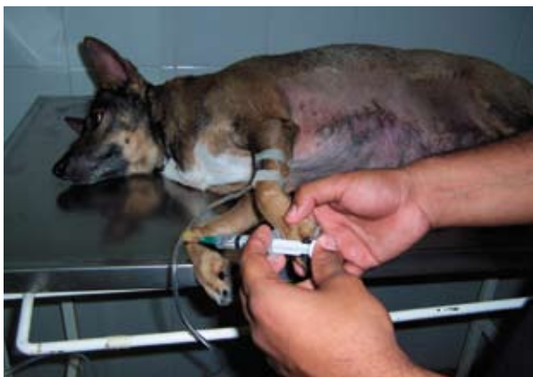
Figura 1. Momento de la administración endovenosa de clorhidrato de lidocaína al 2%.

Es necesario hallar el tratamiento médico adecuado para la constipación del canino, considerando el tratamiento quirúrgico como última opción. Durante 2005, en el Hospital de Clínicas de nuestra Facultad