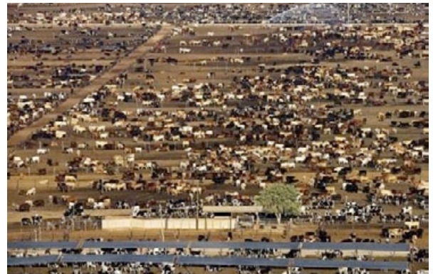
Figura 1. Cría de bovinos en sistema de producción intensivo.

Durante su evolución los bovinos aprendieron a obtener los recursos brindados por el hombre –comida,