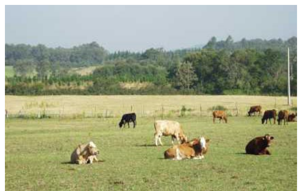
Figura 2. Cría de bovinos en sistema de producción extensivo.