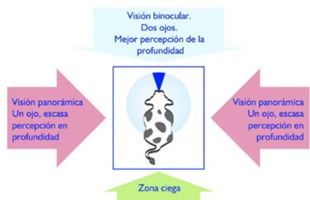
Figura 4. Diagrama de visión del bovino.

Considerando el concepto de bienestar animal podemos enumerar algunas acciones y beneficios al aplicarlo: las buenas técnicas de manejo mejoran el crecimiento y desarrollo de los animales, reduciendo dolor, miedo y reacciones fisiológicas de estrés provocadas por el manejo inadecuado. El suministro de dietas apropiadas y de suficiente agua potable contribuye a mantener la salud y productividad de los animales. Proporcionar condiciones de vida adecuadas a los bovinos puede disminuir la incidencia de comportamientos perjudiciales o anormales. Ambientes, instalaciones y equipos seguros y confortables pueden prevenir lesiones y pérdidas productivas. Al proporcionar espacio adecuado se evitan pérdidas productivas y muertes relacionadas con la superpoblación o hacinamiento. La mejor atención de los criadores o engordadores para con sus animales posibilita el diagnóstico precoz de enfermedades, de disminución de la producción y de