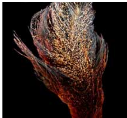
Figura 3. Intensa infestación por liendres de H. quadripertusus en el extremo caudal de un bovino.

establecían alrededor del ano, zona de piel más delgada, propicia para la fijación de los estadios ninfales de los piojos.