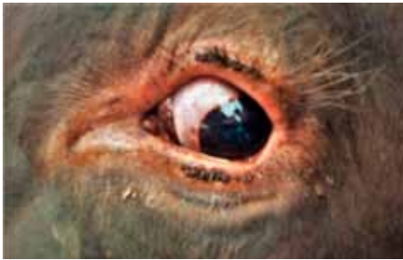
Figura 4. Infestación por H. quadripertusus en los bordes palpebrales de un bovino.