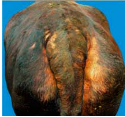
Figura 1. Dermatitis pruriginosa difusa severa con alopecia y presencia de H. quadripertusus .

Las hembras mostraban una infestación por piojos de grado leve, moderado o severo alrededor de la vulva (Figura 2), mientras que en los machos los parásitos se