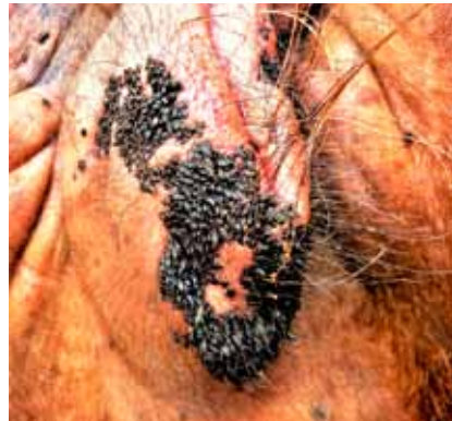
Figura 2. Infestación grave por H. quadripertusus en los labios vulvares