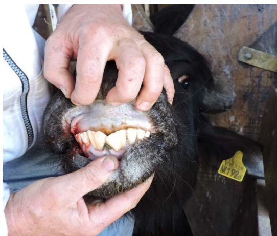
Figura 3. Presencia de ambas pinzas permanentes.