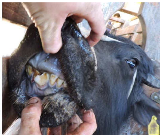
Figura 4. Erupción de la pinza izquierda.